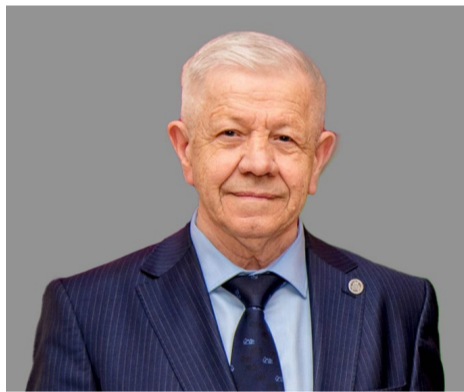
Уважаемые жители и гости городского округа Верхнее Дуброво!