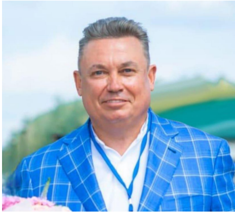
Уважаемые жители Верхнего Дуброво!

С огромной радостью и гордостью поздравляю вас с выдающимся событием — 100-летним юбилеем нашего замечательного посёлка!