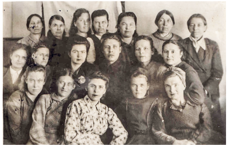
Коллектив больницы. 1949 г.