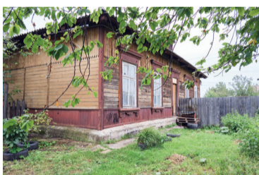
Дом на ул. Пролетарской, построенный в 1885 году