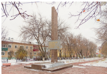
Обелиск в честь погибших в Великой Отечественной войне

Реконструкция памятника на «Аллее Славы» – 2096,21 тыс. руб.;