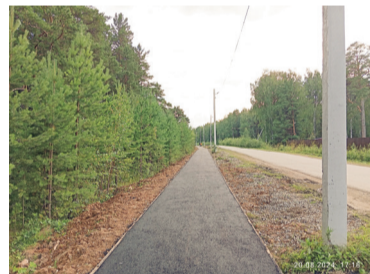
Тротуар от ул. Папанинцев до КП «Дубрава»

Устройство тротуара по ул. Свободы от ул. Папанинцев до КП «Дубрава» – 5842,62 тыс. руб.;