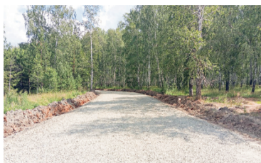
Подъезд к ул. Дачная

Планировка, выравнивание дорог по ул. Добрая, Уральская, Западная, от подъездной дороги к пгт Верхнее Дуброво до ул. Дачная – 298,57 тыс. руб.;