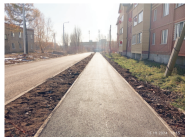
Дорога и тротуар по ул. Победы

Ведутся работы по ремонту участка автомобильной дороги и тротуара по ул. Победы (1 этап) – 20 000,00 тыс. руб.;