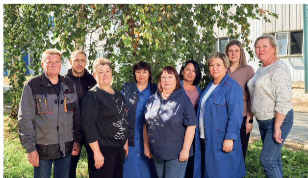
Служба технического контроля