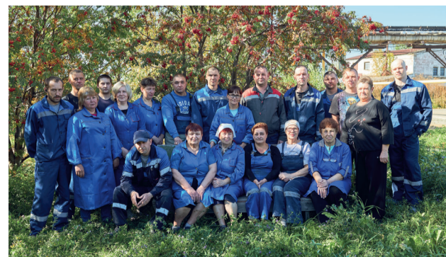
Цех №1 по выпуску кругов на керамической связке