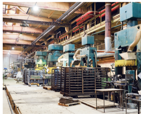
Формовочный участок цеха №2