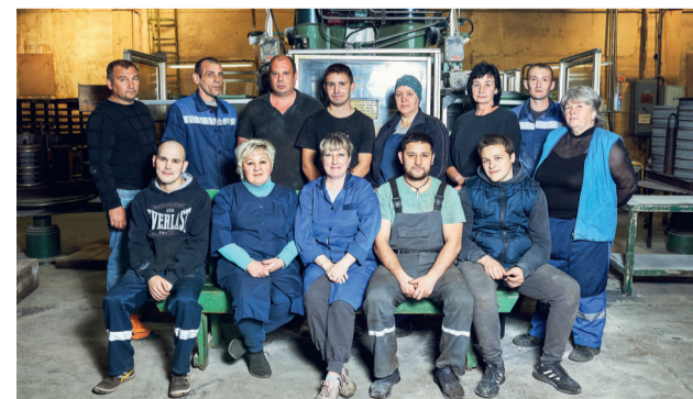
Цех №2 по выпуску кругов на бакелитовой связке