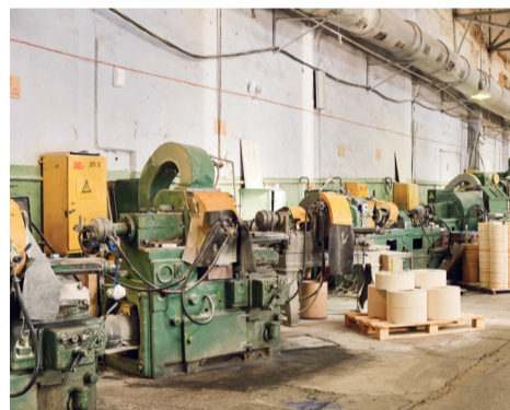
Токарный участок цеха №1