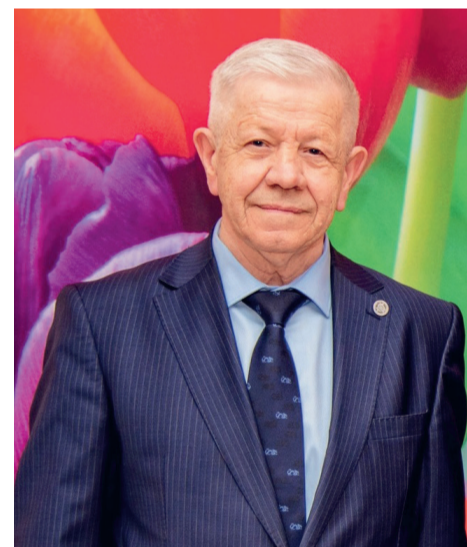
Уважаемые работники и ветераны отрасли машиностроения!

Примите самые тёплые поздравления с профессиональным праздником! В городском округе Верхнее Дуброво этот замечательный праздник занимает особое место в жизни многих людей, судьбы которых прочно связаны с богатой историей Косулинского абразивного завода.