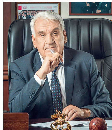
Уважаемые работники и ветераны машиностроительной отрасли! Поздравляю вас с профессиональным праздником – Днем машиностроителя.