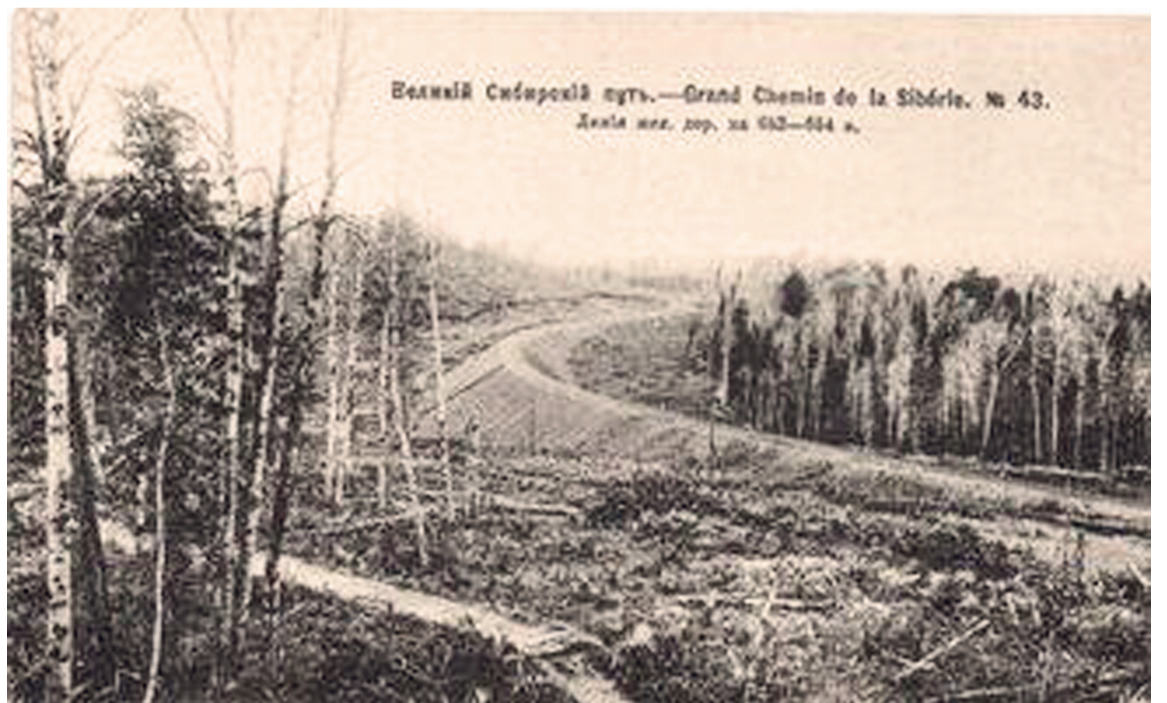
Великій Сибирскій путь. — Grand Chemin de la Sibirie. № 43. Делія нѣк. дор. за 442—444 в.