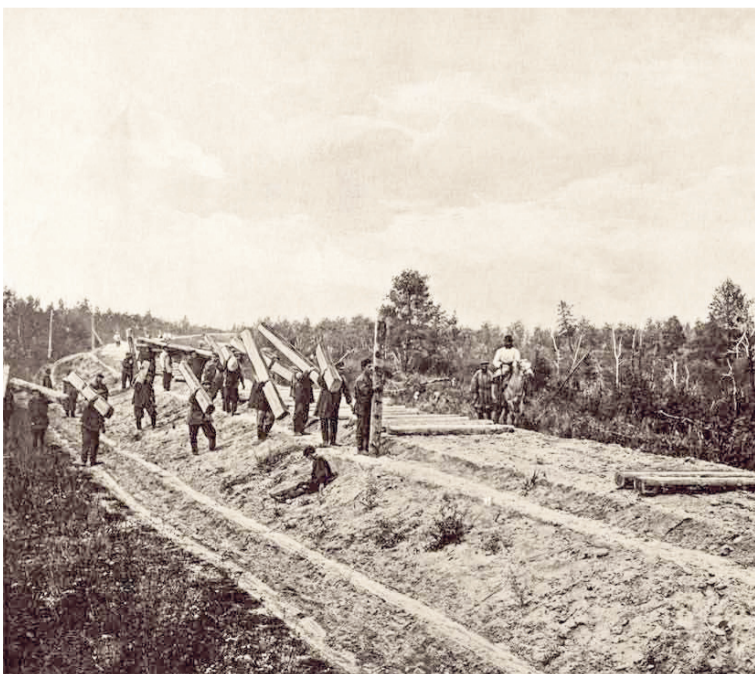
Начало строительства железных дорог России