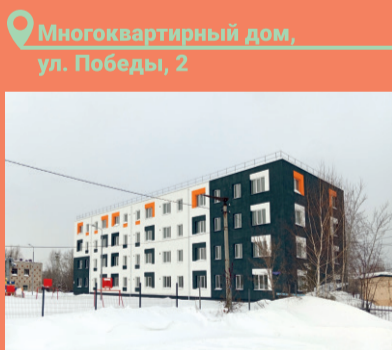
Многоквартирный дом, ул. Победы, 2