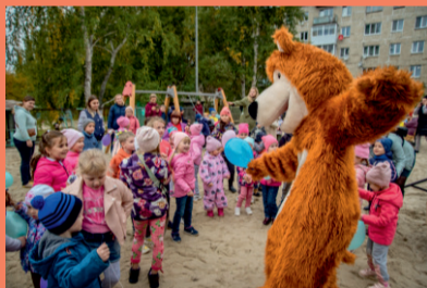
Детская площадка, ул. Победы, 7