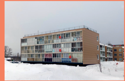
Многоквартирный дом, ул. Уральская, 1