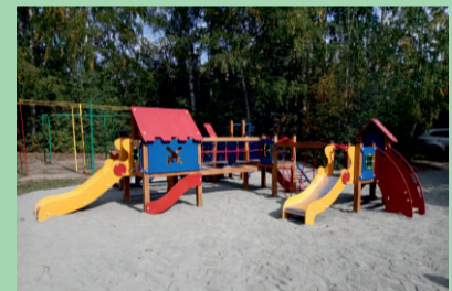
Детская площадка, ул. Рябиновая