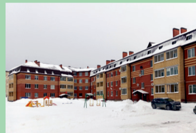
Многоквартирный дом, ул. Победы, 3