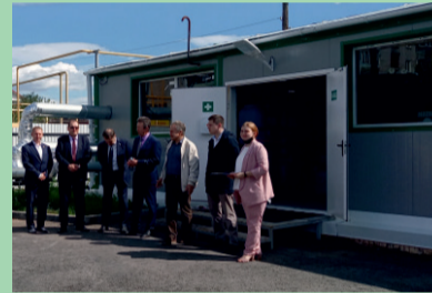
Блочная газовая котельная в микрорайоне «Лесхоз»