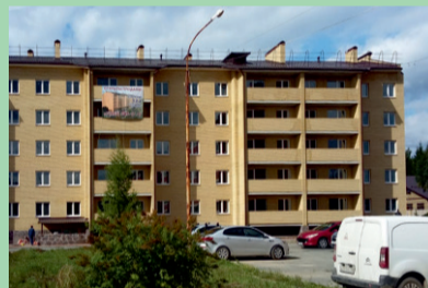
Многоквартирный дом, ул. Победы, 11