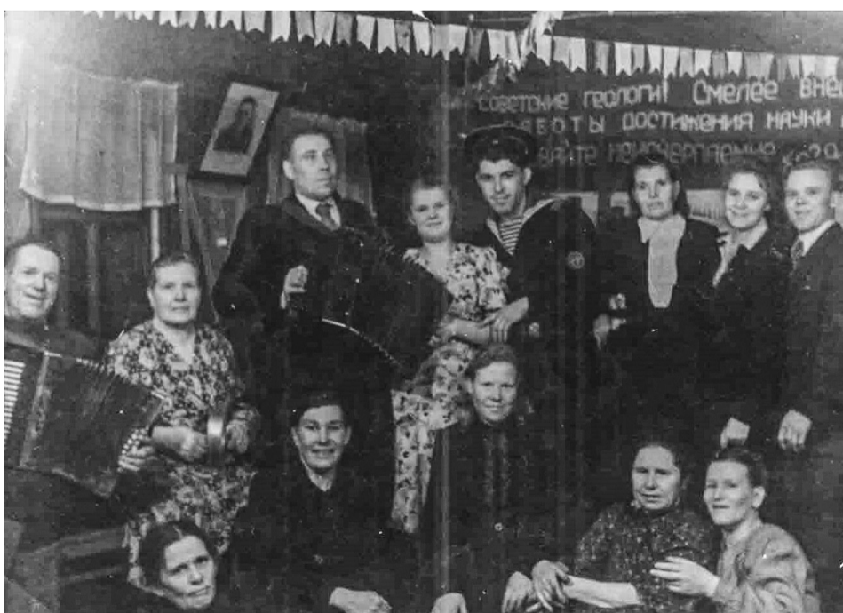
Коллектив Косулинской геологоразведочной (геофизической) партии. 1947-1955 гг.