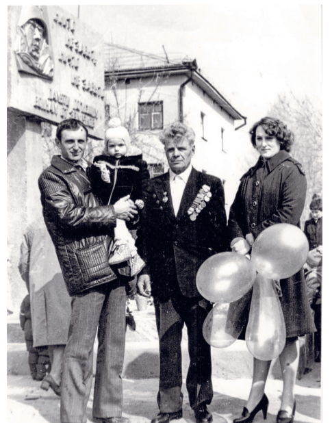
Жила Г. Ф. с сыном и внуком