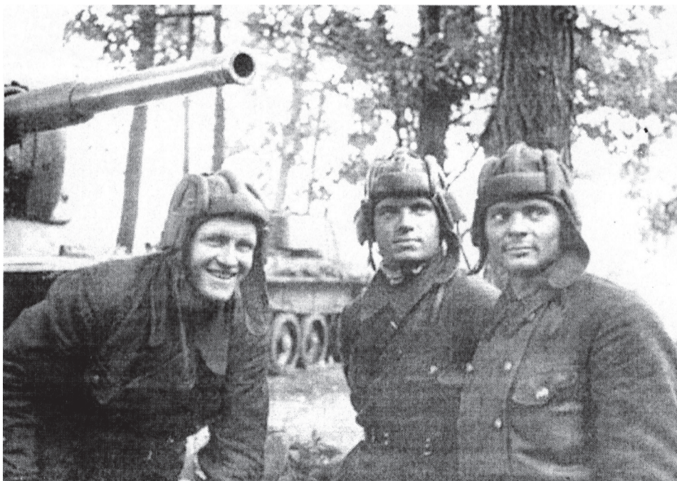
Лучший экипаж танка Т-34