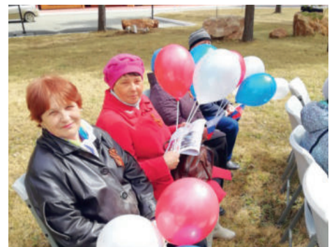
День Победы 9 мая