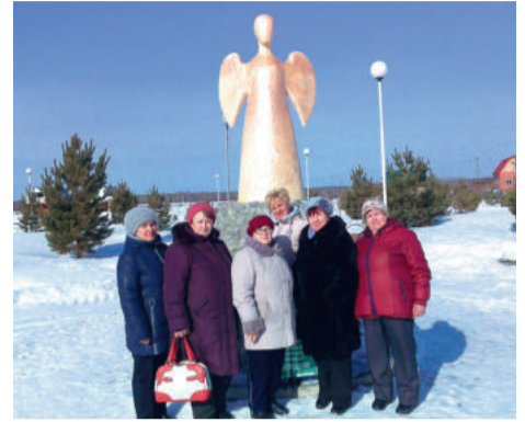
Оздоровление работников - поездка в санаторий «Обуховский»

Мы гордимся тем неоценимым вкладом, который внесла профсоюзная организация в развитие Косулинского абразивного завода и поселка Верхнее Дуброво, способствуя повышению профессионального уровня рабочих кадров и производительности их труда, организовывая досуг и создавая условия для развития спорта, массового оздоровления работников и их детей, борясь за сохранения трудовых коллективов.