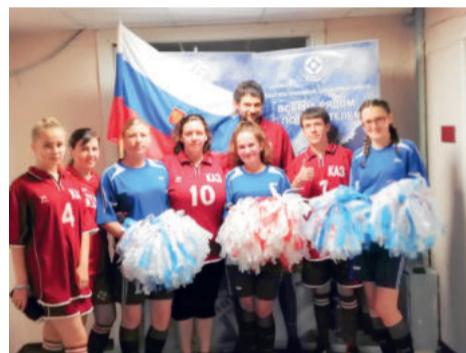
Принимаем участие в спортивных мероприятиях