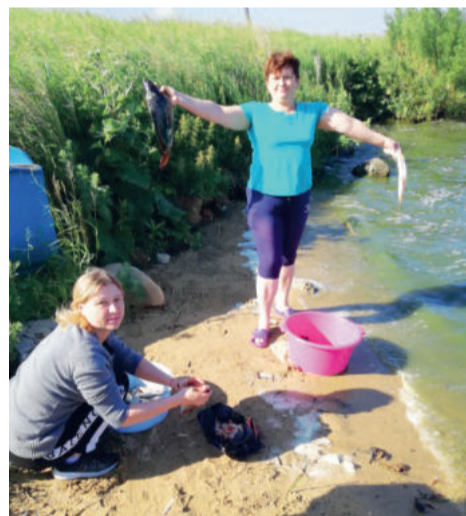
Участвуем в корпоративном мероприятии с ОАО «ПСМ» - «День Рыбака»