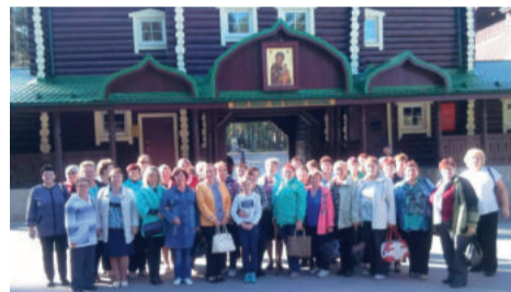
Поездка на Ганину Яму